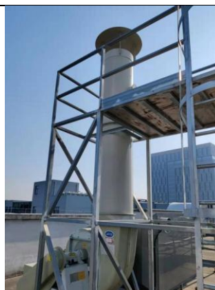
危废库配套废气处理设施