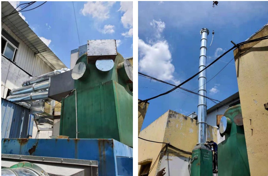
图 3-2 废气治理设施及排气筒