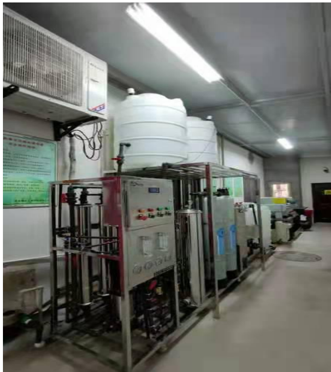
图 3-1 废水过滤循环设施