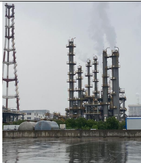
建设项目场地北面