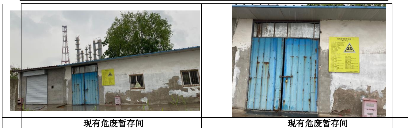
图 1-1 项目建设场地现状及现有危废暂存间照片

2) 针对项目西侧南京化工技师学院（长芦校区），南京金陵塑胶化工有限公司提出的整改提升措施及要求如下：