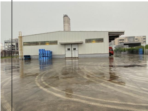
建设项目场地南面