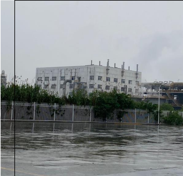
建设项目场地东面