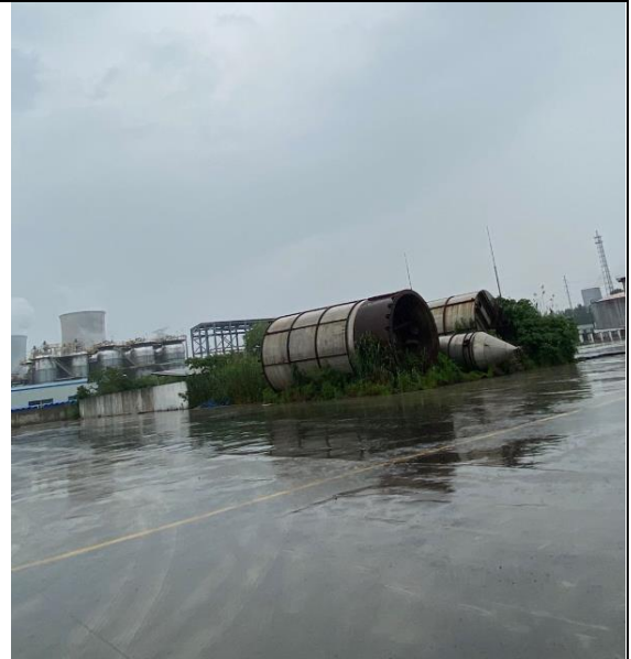
建设项目场地西面